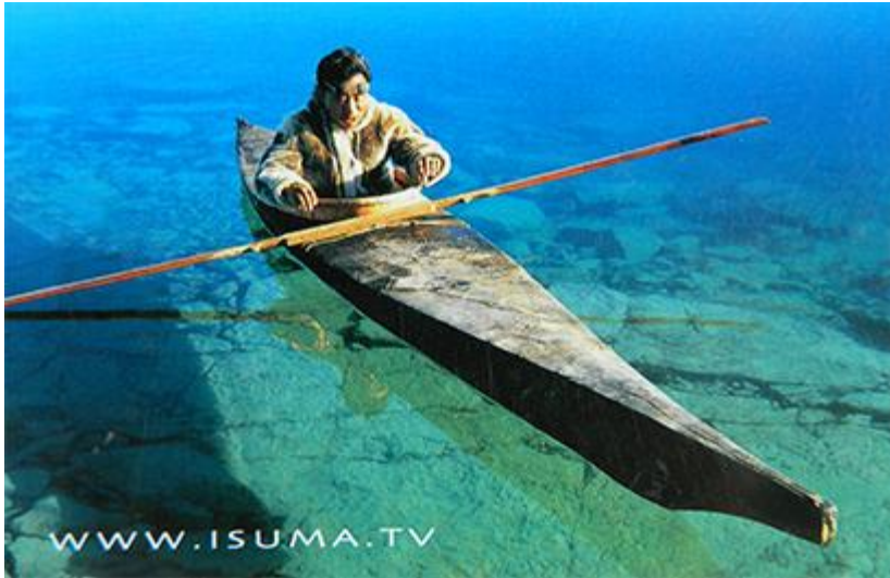
Imagen 17: IsumaTV de Canadá.

En cuanto a las Muestras que derivan de los Festivales, cada país es responsable de poder hacer la difusión, de tomar la iniciativa. Nosotros hemos tomado en Gulumapu por ejemplo, desde el 2004 que hicimos el VII Festival, la norma de tratar de hacer cada año una Muestra de cine. El desafío es llevarla a otras regiones. Para este año queremos hacerlo en dos lugares, Santiago y Temuco, y empezar a hacer las réplicas en otras partes. Pero siempre es insuficiente, uno se da cuenta de que es insuficiente. Lo otro es que hacemos los paquetes de difusión, que ya se ha convertido como una práctica. Antes éramos mucho más aprensivos y cuidadosos con los materiales audiovisuales, porque no estábamos familiarizados con el proceso, pero ya sabes cómo funciona, todo es aprendizaje y proceso. Organizamos los paquetes de difusión con la autorización de los realizadores para estimular y promover que la gente planifique sus muestras de cine y ya no es una exclusividad de las organizaciones que forman parte de CLACPI. Le llega también a la gente de la academia, nos importa que hagan mención de que esto forma parte de un proceso y que el movimiento indígena está en una apuesta. Eso nos interesa, que al menos alguien haga una mención en esa dirección. Además, no están autorizados para ser vendidos.