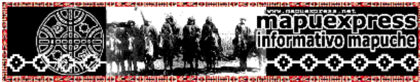
Imagen 12: Logotipo informativo electrónico mapuexpress - http://www.mapuexpress.net

Las comisiones, que hay hoy día, son: una de sensibilización, que la tenemos nosotros en el sur: mapuexpress - Chile.