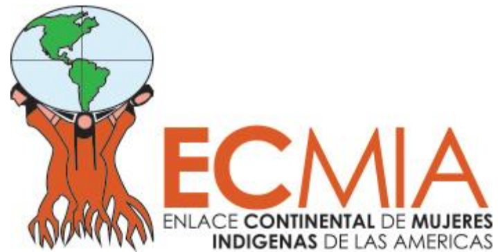
Imagen 07: Logotipo del Enlace Continental de Mujeres Indígenas.

Las comisiones son una forma de descentralizar CLACPI, que no sólo una persona o una coordinación conduzca CLACPI, sino que las decisiones y las definiciones se hagan de manera colectiva, con Centro América, México, Bolivia, y que estos de algún modo involucren a los que están más próximos, esa es la apuesta. Que estén representados, reflejadas las diferentes formas de hacer comunicación, porque son diversas, porque son experiencias de trabajo distintas, se trabaja con métodos distintos y con experiencias diversas. Además, no todos son indígenas, hay alianzas, es bien diverso, hay unos lugares donde es más político, hay otros que menos, hay unos que están más insertos dentro del movimiento, grupos de comunicación, productoras, etc.