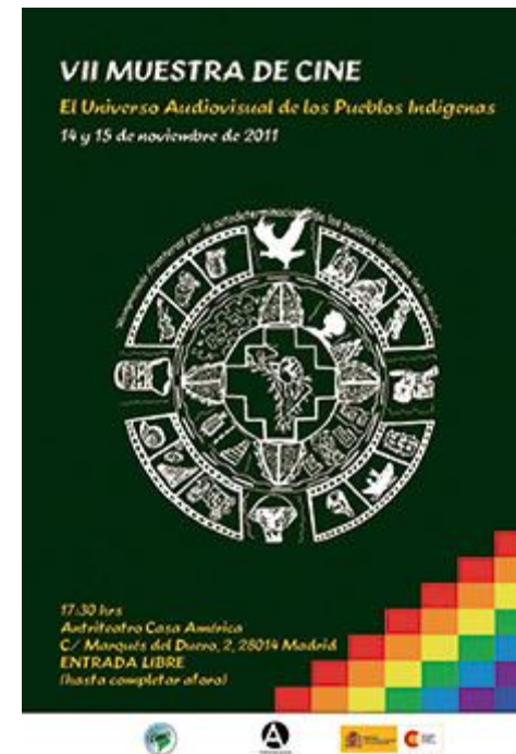
Imagen 11: Afiche de Muestra realizada en Madrid, España el año 2011.

Existen otras instituciones más con quienes trabajamos en España, ahora está todo por verse dada la realidad en Europa, con ACSUR Las Segovias, l'Alternativa de Barcelona, y otros con quienes esporádicamente se realizan muestras de cine ya sea en alianza con universidades o centros culturales. Planifican y organizan sus muestras de cine indígena con los trabajos que se envían. Se procura coordinar la muestra de cine de CLACPI, que organizamos en Casa de América-Madrid con ACSUR y l'Alternativa por ejemplo.