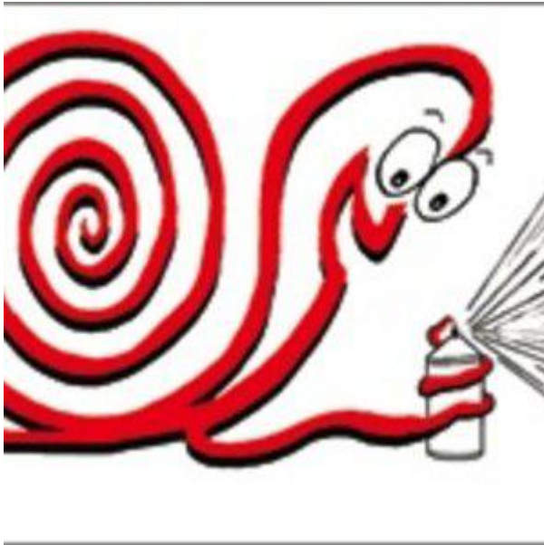
Imagen 15: Logotipo de Caracol Producciones de Guatemala.