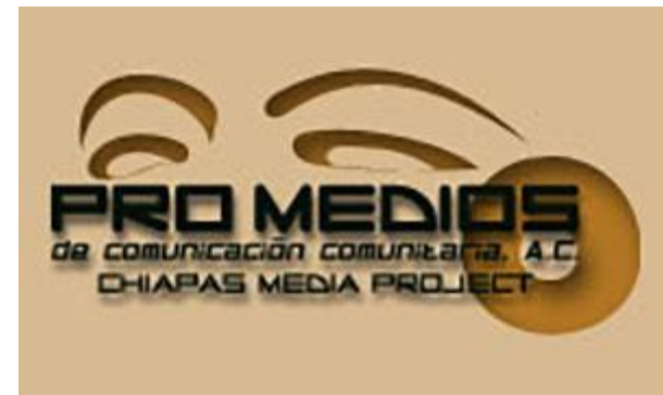
Imagen 16: Logotipo de Promedios de Comunicación Comunitaria de México.

CLACPI tiene muchas desventajas, pero tiene muchas cosas muy fuertes que tienen que ver con eso, con el compromiso, la gente que está aquí es la gente que quiere participar y que quiere hacer cosas y hacer cambios. A veces no se toma conciencia de las restricciones que puedan tener los materiales. Siempre ha sido un desafío el tema de la distribución. No es algo que no hayamos pensando, sino que más bien es un tema que no hemos podido abordar con la profundidad ni con el tratamiento que merece, porque las realidades de los miembros que forman parte de CLACPI son diversas.