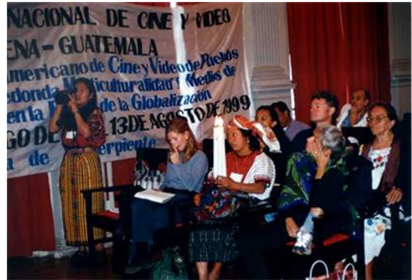
Imagen 04: VI Festival Latinoamericano de Cine de los Pueblos Indígenas, "Tras la Huella de la Serpiente" Quetzaltenango-Guatemala, 1999.