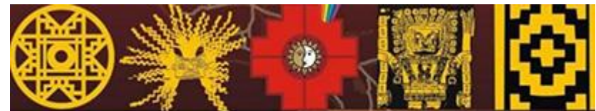
Coordinadora Andina de Organizaciones Indígenas

Los comunicadores no estamos todavía tan empoderados con el tema político, no así los dirigentes de otros ámbitos: de las organizaciones indígenas, del medio ambiente, del ámbito de géneros. Ellos cuidan su terreno y su parcela, pues está súper parcelado. Creo que las jugadas están mal hechas. Pese a que CLACPI tiene más de 20 años, y dentro de eso, desde el momento en que el mundo indígena asume la dirigencia del CLACPI, que es desde el 2004, casi 10 años, desde ahí nosotros no hemos logrado romper esas fronteras. Es duro porque el mundo indígena ha tomado mucho del mundo político partidista, entonces se cuida mucho.