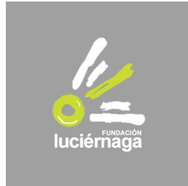
Imagen 14: Logotipo Fundación Luciérnaga de Nicaragua.

Ahora nuestras energías están focalizadas en reforzar el trabajo de comunicación en Centroamérica. Nos interesa realizar un par de talleres y encuentros con mujeres en Nicaragua, donde tenemos socios y miembros, y Honduras es otra sede para una posible actividad. Un mandato de la asamblea de CLACPI es justamente apoyar el trabajo de comunicación en Centroamérica, está la iniciativa de apoyar una red en Mesoamérica y Centroamérica. Hay grupos y colectivos que están dentro de Centroamérica. La apuesta es armar una red, apoyar la conformación de una red a través de Mesoamérica y que eso le dé un impulso a la región. La iniciativa nace de colectivos mexicanos, guatemaltecos y nicaragüenses que CLACPI recoge, y para que no quede sólo en una carta de intención, tenemos que apoyar para que se haga. La idea es primero hacer una reunión de coordinación con algún taller que nos permita tener un panorama de lo que está pasando en comunicación en Centroamérica y resolver juntos las pertinencias de propiciar alianza e intercambio, eso es una red.