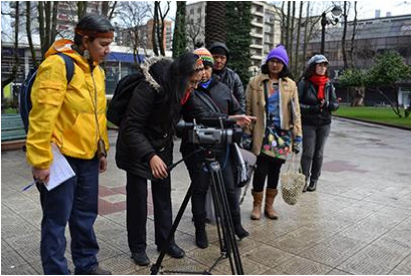
Imagen 08: Taller de guión y montaje para mujeres indígenas. Agosto 2012, Temuco, Chile.

Eso es una de las cosas buenas de CLACPI, la riqueza de que no hay un método y una sola línea, y que no tiene que ver con que todo sea indígena, o que todos tienen que ser organizaciones o colectivos de exclusividad en el tema indígena. Sin embargo, hemos pasado por pequeñas crisis de definición, como por ejemplo si todos los que estén a la cabeza deben ser indígenas. Se ha cuestionado, no es fácil. Pero la riqueza de CLACPI está justamente por esta diversidad, y siento que CLACPI va a ir creciendo en la medida que se mantenga esta diversidad de integrantes, de miembros y de miradas.