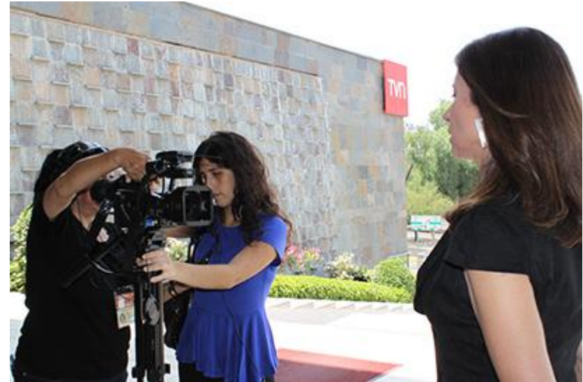
Imagen 09: Campaña "Sumando Voces" realizada el 2013 por CLACPI.

Ha sido una buena experiencia, ha funcionado como intercambio, ha fluido espontáneamente para nosotros, seguro mucho más elaborado desde Canadá para acá, pero ha sido súper interesante y beneficioso para ambos, porque se aprendido, se ha aprendido a valorar los cortitos, su lenguaje, las miradas de ellos, el que te comenten, la gente ya sabe de Canadá, sabe qué está pasando allá, que los chicos tienen problemas con la drogadicción, que están muy solos. Este año, por ejemplo, hubo una campaña y la gente se sumó a la campaña de Canadá, se hizo difusión, y eso no hubiese sido posible si es que nosotros no conociéramos la realidad canadiense. Y viceversa, la campaña que hicimos aquí, "Sumando voces", al revés también se sumaron mandando alguna notita. Creo que eso es una alianza.