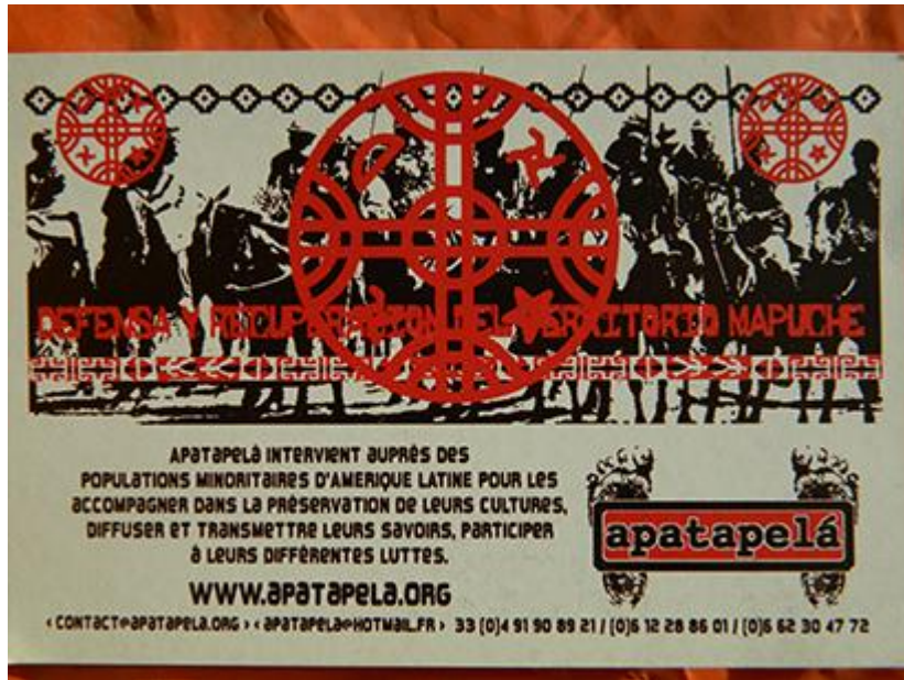
Imagen 10: Logotipo Colectivo Apatapelá, Marsella, Francia.