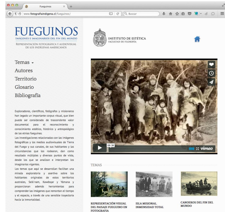
Sitio Web "Fueguinos, imágenes e imaginarios del Fin del Mundo".