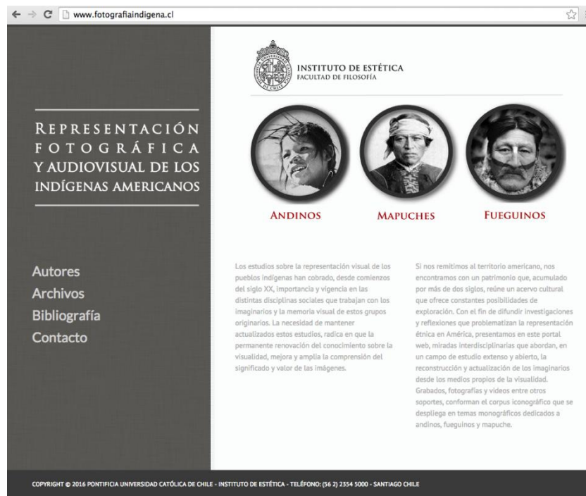
Portal web "Representación fotográfica y audiovisual de los indígenas americanos" ( www.fotografiaindigena.cl ).