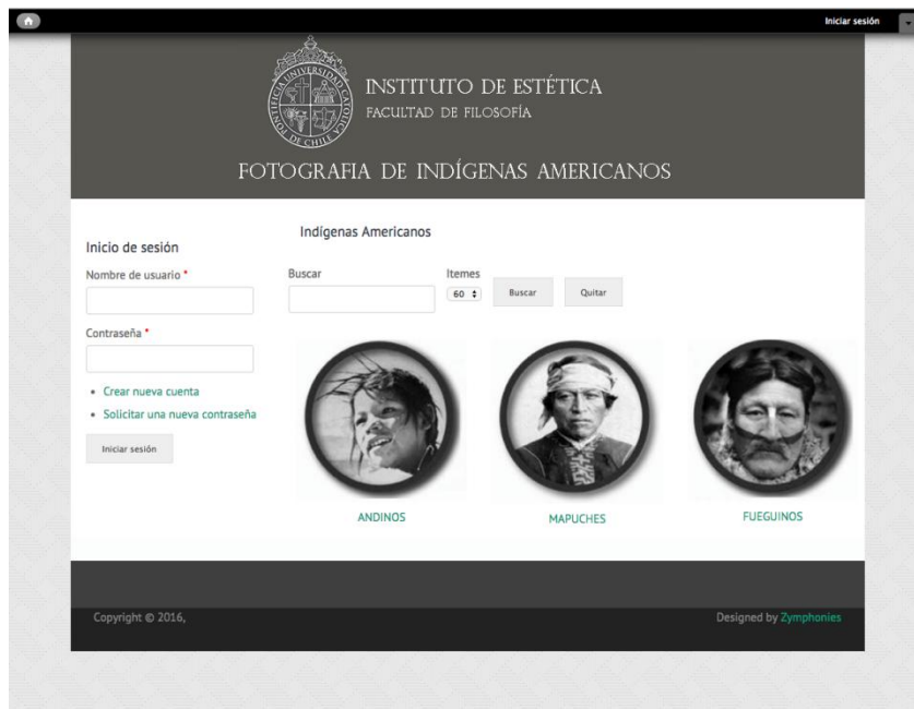
Página web del "Archivo Fotográfico de Indígenas Americanos" del Instituto de Estética de la Pontificia Universidad Católica de Chile.

Fruto de ello, se elaboraron publicaciones que reflexionan sobre la significación de la representación visual de los pueblos indígenas de lo que actualmente es Chile, y también América, a partir de un corpus visual que abarca desde las fotografías patrimoniales de fines del siglo XIX y comienzos del XX hasta los registros etnográficos, folclóricos, documentales y/o familiares desarrollados durante todo el siglo XX.