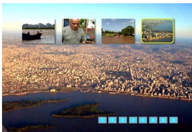
Menú 7 de DVD "Crónicas Etnográficas..." ("crónicas etnográficas" N. del T.) (Devos, 2007).