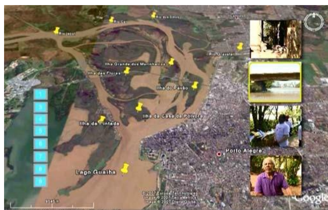
Menú 2 de DVD "Crônicas Etnográficas..." ("crônicas etnográficas" N. del T.) -(Devos, 2007).