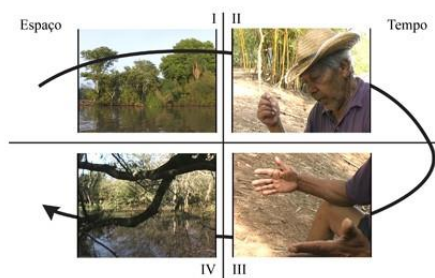
Imágenes: documental A Morada das Águas (“ La morada de las aguas ” N. de los T.) (Rafael Devos & Ana Luiza C. Rocha, BIEV/UFRGS, 2003).

Son esos “golpes” (de Certeau, ibid) de memoria que mediatizan transformaciones espaciales y “hacen ver” aquello que hasta entonces era invisible, un otro tiempo inscrito en el lugar 4 :