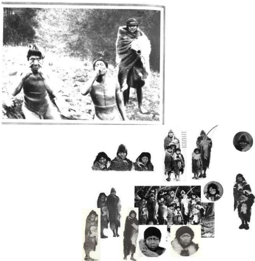
Foto-collage 11. Fragmentos de fotografía publicados por Gallardo (1910: 1, 2, 16, 99, 106, 145, 151, 235, 237, 250, 380) Foto 12. Bridges (1951: XL)

identifican a los individuos por sus nombres, y se proveen algunas de sus características físicas y sus relaciones de parentesco. Por el contrario, en el libro de Gallardo se publicaron 11 fragmentos de esta fotografía (foto-collage 11) sin dar cuenta de que se trata de recortes de una misma foto, si bien se consignan en algunos casos los nombres de los individuos fotografiados. Esto refleja un uso principalmente decorativo de las imágenes, en el que la fotografía quedó reducida a la ilustración de lo exótico, presentado de manera poco rigurosa y totalmente fuera de contexto. La fotografía no fue tratada entonces como documento sino como ornamento, lo cual se refuerza por el frecuente uso de fotografías (enteras o fragmentadas) enmarcadas en viñetas con reminiscencias de estilo art déco . Esta manipulación de la información escrita y visual sugiere que el foco estaba centrado principalmente en la exhibición de lo exótico (sin importar su origen, representatividad ni fidelidad) por sobre el registro sistemático de rasgos.