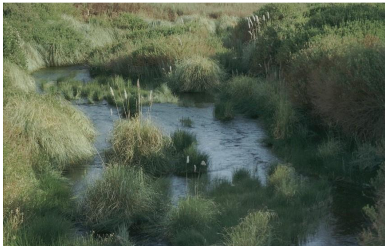
Los cursos de agua son imágenes captadas con gran dedicación por los caspaneños.

En relación a las instituciones mencionadas en televisión son diversas, pero se sintetizan en Conadi, empresas mineras y municipios. En el programa se busca generar vínculos de acción entre estas organizaciones y la realidad local. En el caso de “Caspana”, se menciona a la “empresa San Miguel” y constantemente a Conaf, la responsable de la creación del parque. Se podría decir que la contraparte a estas instituciones podría estar en el concepto de “comunidad”. Aquí las instituciones y la comunidad están enfrentadas, y es el video un arma de dicho conflicto.